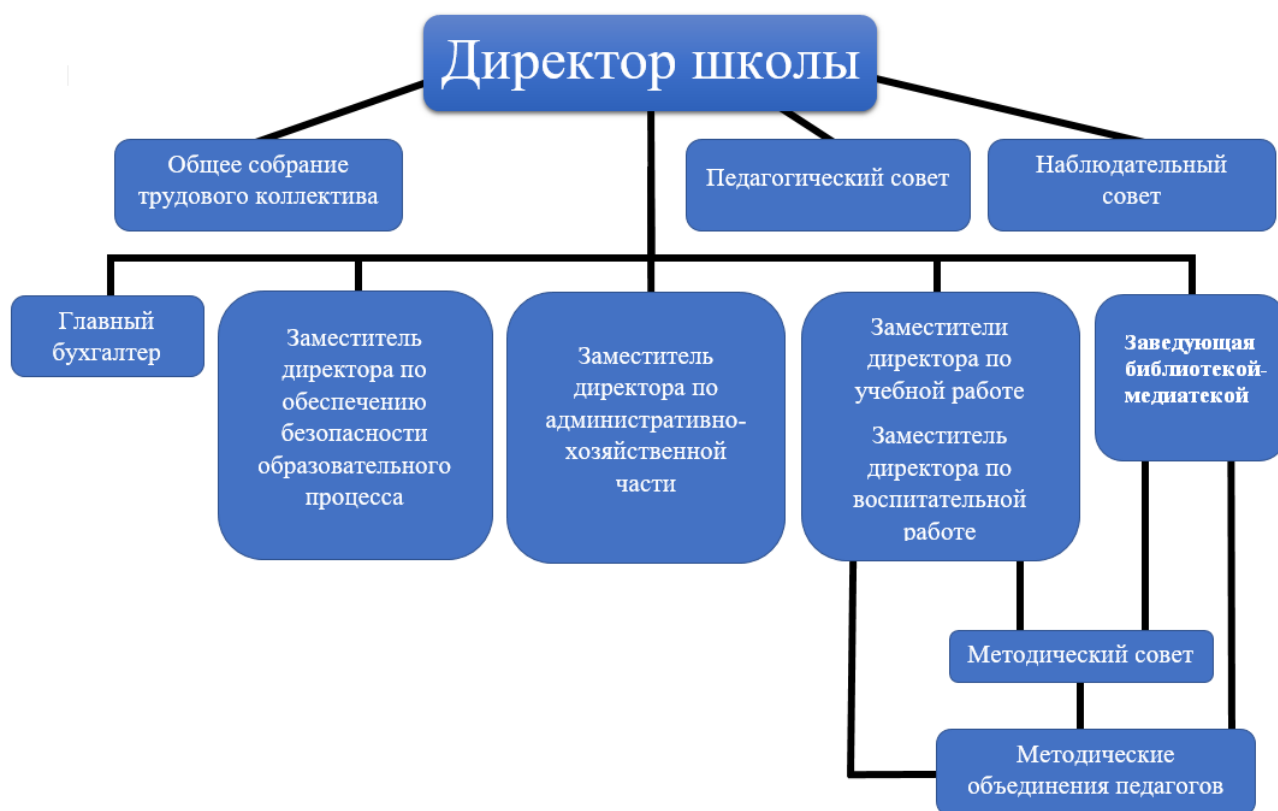
Рис.1 Схема структуры управления

Общее собрание работников – орган самоуправления, объединяющий всех работников Учреждения. Функции Общего собрания работников: